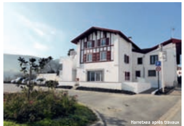
Harretxea après travaux

Demain avec l'arrivée des locataires et l'ouverture du commerce, Harretxea s'inscrira à nouveau dans la vie du quartier.