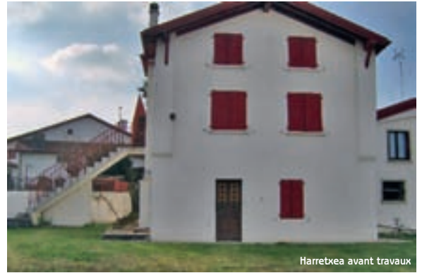
Harretxea avant travaux