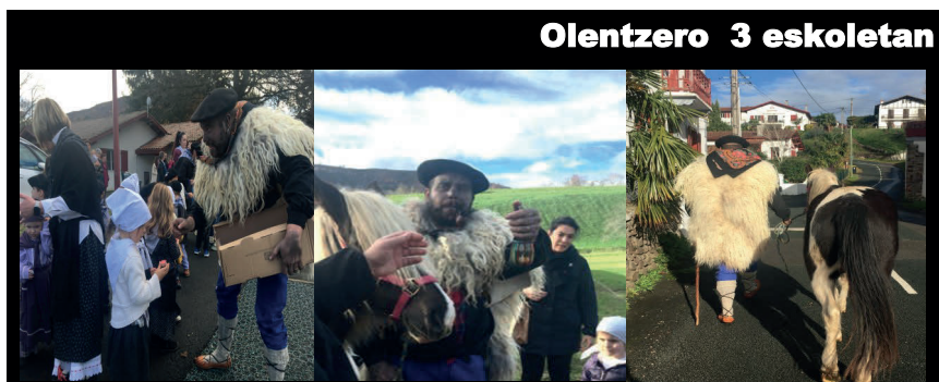
Olentzero 3 eskoletan

O! Mugimenduaren eta argiarekin duen loturaren bidez harridura pizten duen pieza da, keinu koreografiko abstraktu eta poetikoa. Eskerrik asko Elirale konpainiari eta Itsasuarrak elkarteari Atharri ezker paretan erabiltzen uztea gatik.